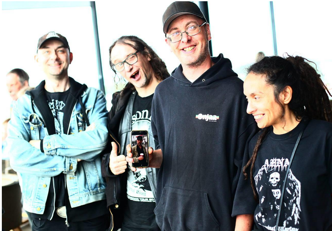
Anti Social Rejects, Helsinki 2016

Anti Social Rejects , «ASR». Hardcore/punk band fra Oslo, aktive siden 2006.